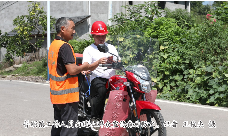
普顺镇工作人员向进山群众宣传森林防火。

本报讯（记者 杜俊）当前，垫江遭受连晴高温，我县各单位持续强化森林防火的宣传和巡护等工作，织密森林防火“安全网”，切实保障森林资源安全和人民群众生命财产安全。 连日来，桂溪街道紧抓进山入林火源管控，强化巡查值守，从源头上守住山、看住人、管住火。