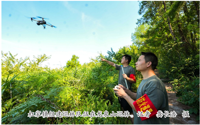
杠家镇组建巡林队伍在龙泉山巡林。