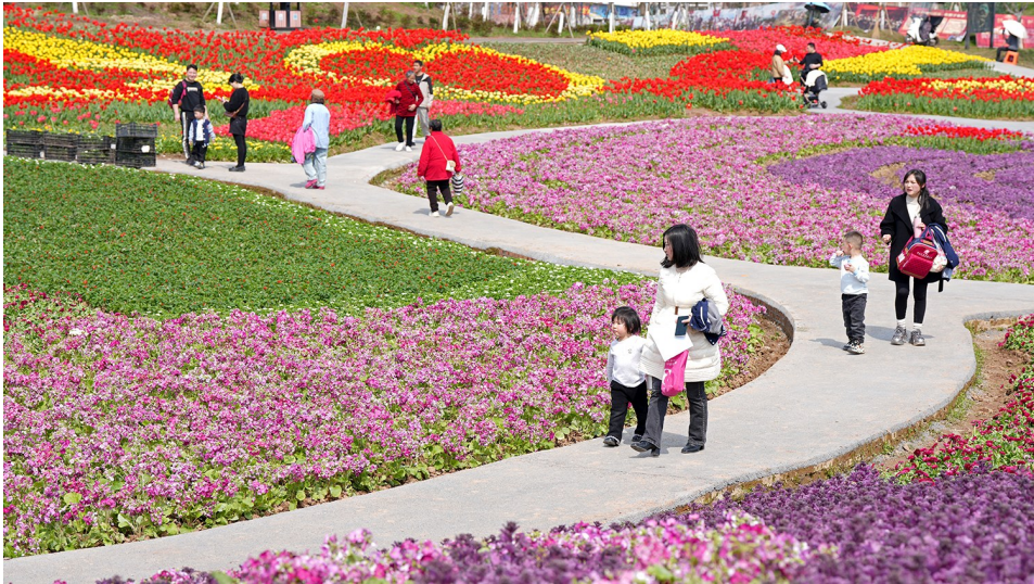
牡丹樱花世界景区,游人如织。