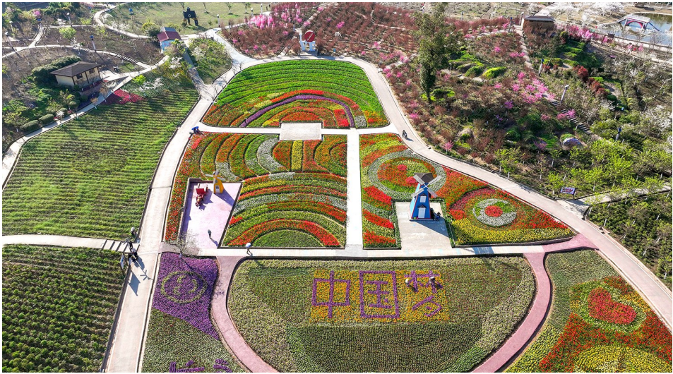
牡丹樱花世界景区,郁金香和樱花竞相绽放。