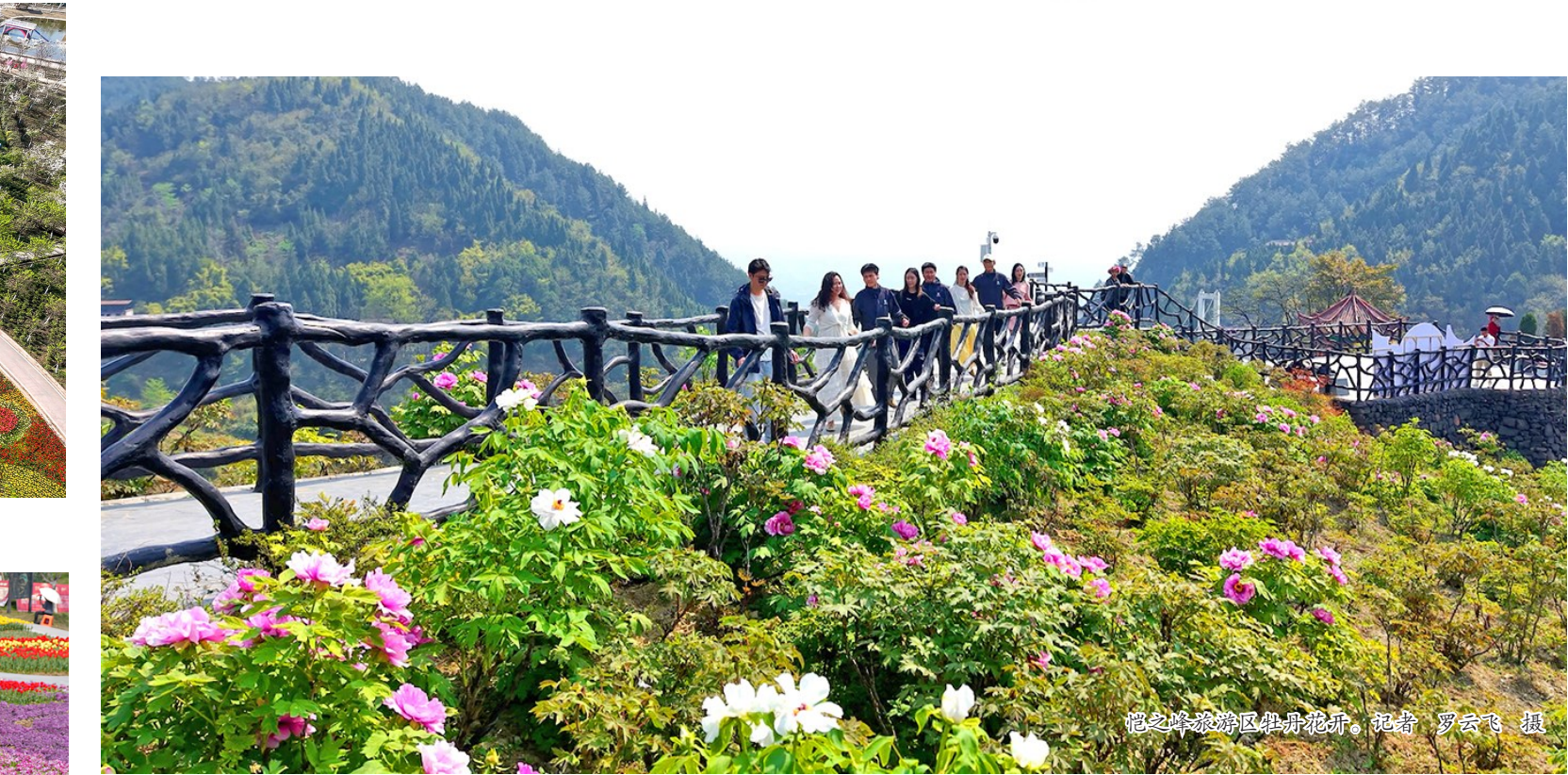
垫江旅游景区牡丹花开。记者 罗云飞 摄