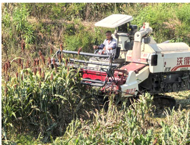
左图:长龙镇长久村路网畅通。

2024年,长龙镇完成套种高粱2000亩、小麦50亩、大豆玉米带状复合种植1000亩、蜜本南瓜3000亩,培育种植产业2个,榨菜规模种植突破4000亩。