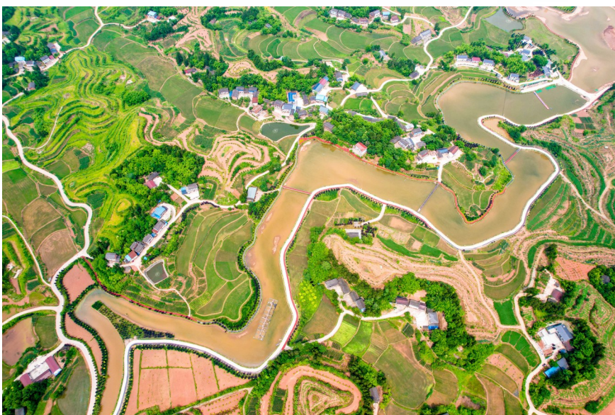
强产业 夯实乡村振兴根基

2024年,在县委县政府的坚强领导下,长龙镇认真贯彻落实党的二十届三中全会精神,全面对标建设“六个区”的要求,锚定“县城后花园”建设目标,坚持“一园一带”工作思路,全镇上下凝心聚力、实干担当,以扎实举措、务实作风推动各项工作守正创新、提质增效。