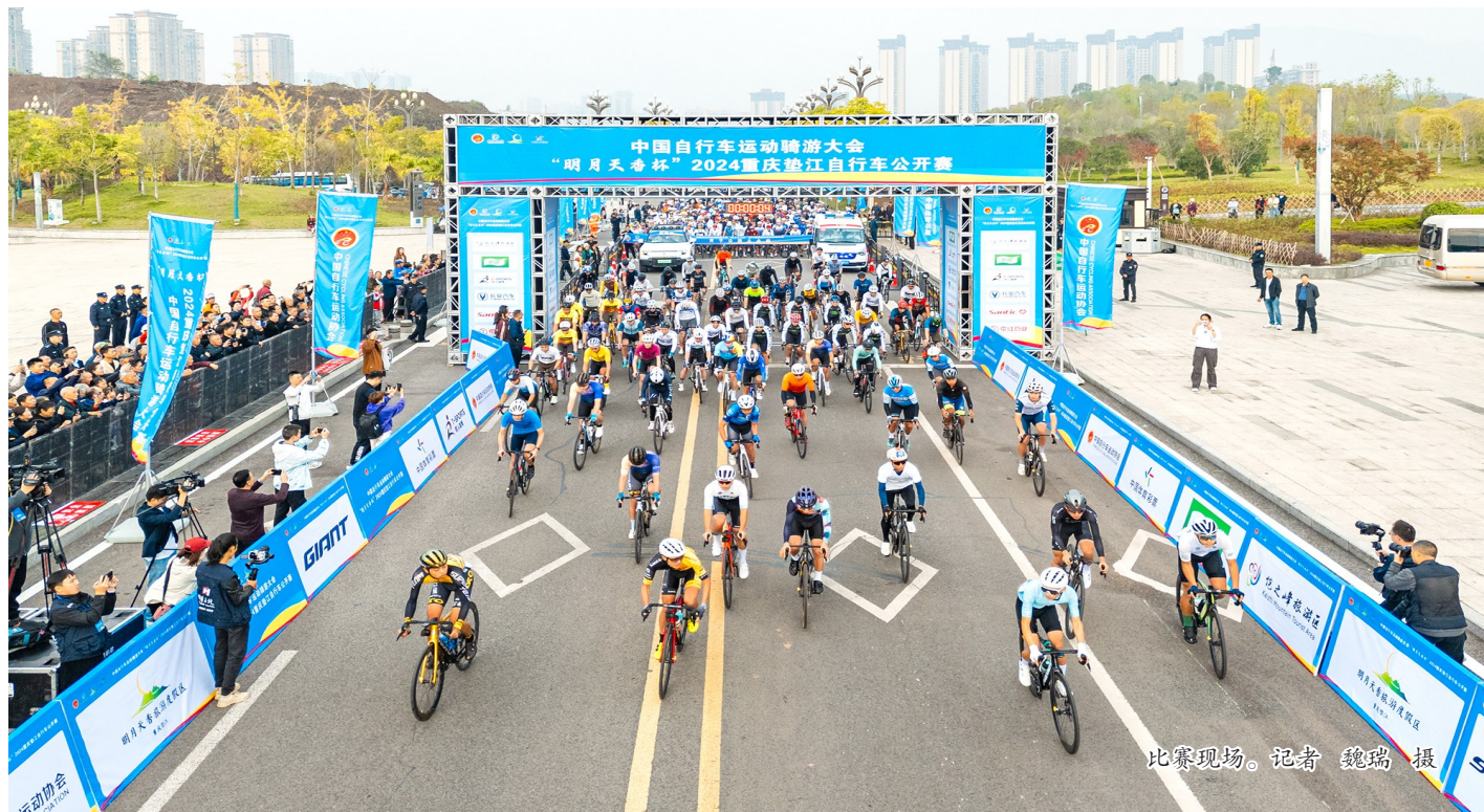
比赛现场。

本报讯(记者 张瀚月)10月27日上午,“明月天香杯”2024重庆垫江自行车公开赛开赛,吸引了来自国内外的五百余名运动员和骑行爱好者参赛,共同展开一场速度、技巧与耐力并重的竞技。