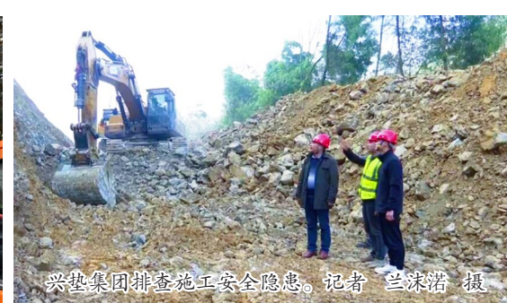
兴基集团排查施工安全隐患。