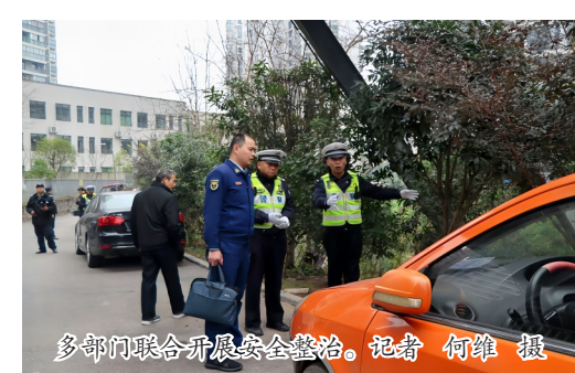
多部门联合开展安全整治。