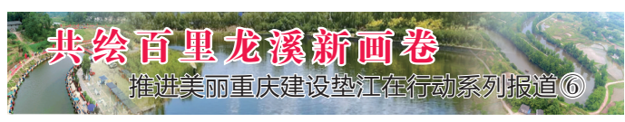
共绘百里龙溪新画卷 推进美丽重庆建设垫江在行动系列报道⑥

转土地30多亩,建设栀子花、桂花种植基地,不但提升了农村整体环境,也让村民有了更多获得感。据介绍,大井村的栀子花基地只卖栀子叶,一年可以采收多次,主要用于花店的鲜花装饰。这样的种植模式具有投资小、风险低、周期短、管理方便的特点,很是符合当地发展。