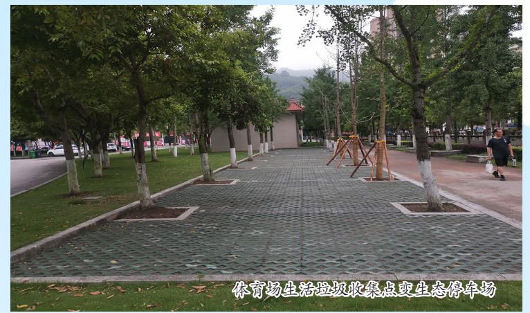
体育场生活垃圾收集点变生态停车场