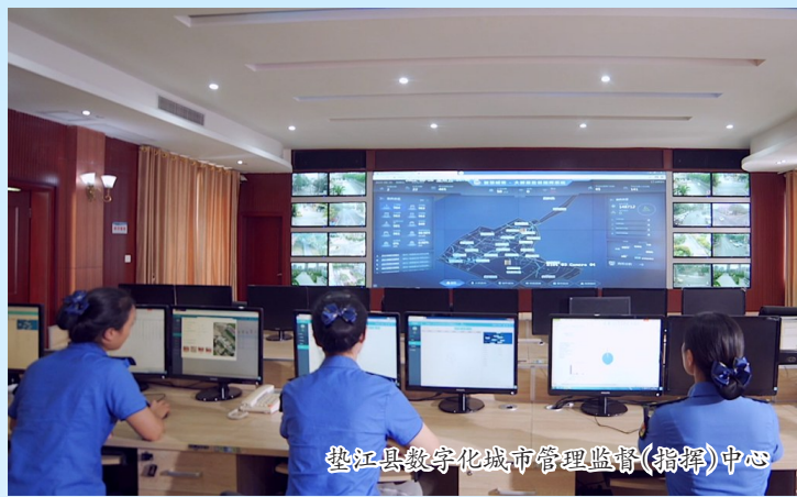
垫江县数字化城市管理监督(指挥)中心