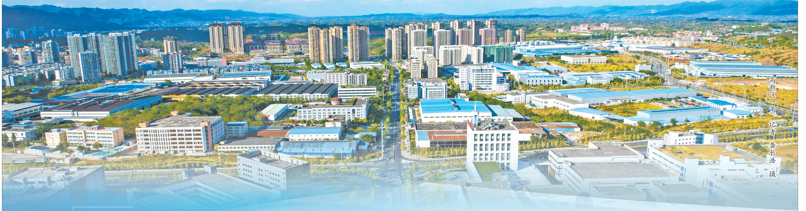
高新区一角