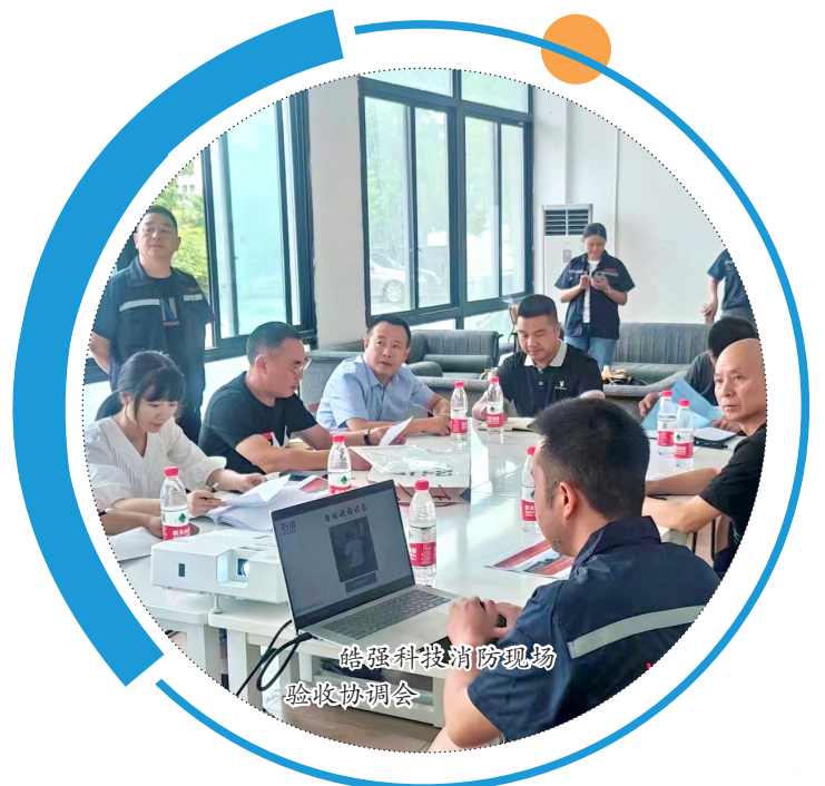
信华新材料消防现场验收协调会