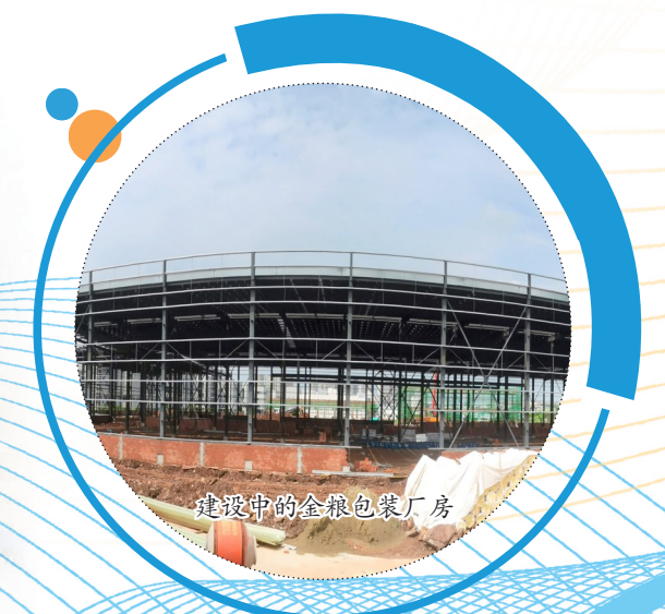
建设中的金粮包装厂房