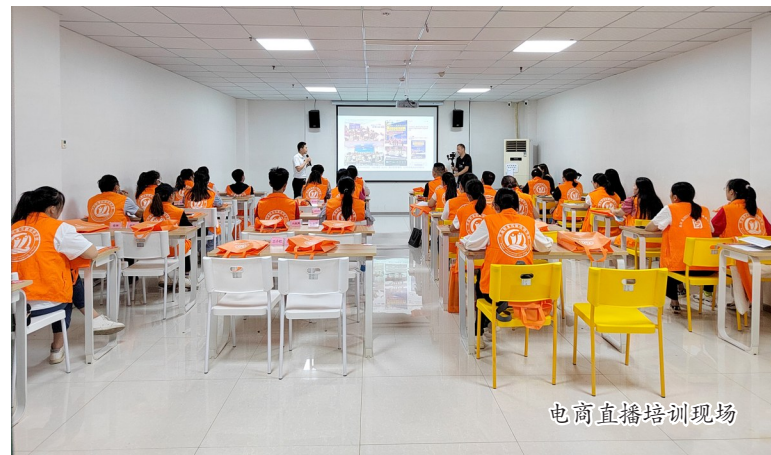
电商直播培训现场