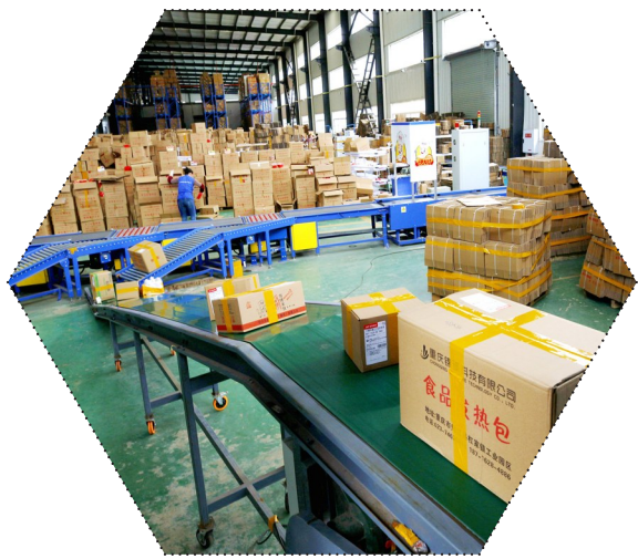
电商公共仓发货现场

接下来,县商务委还将加快渝东电商产业园建设,引导优质电子商务企业入驻;加快打造新型乡村电商孵化服务体系,加快推进镇、村电商孵化中心项目建设,加大市场主体的培育力度,助力乡村振兴。