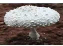
颜氏鹅膏 Amanita yoshii Zhu L.Yang