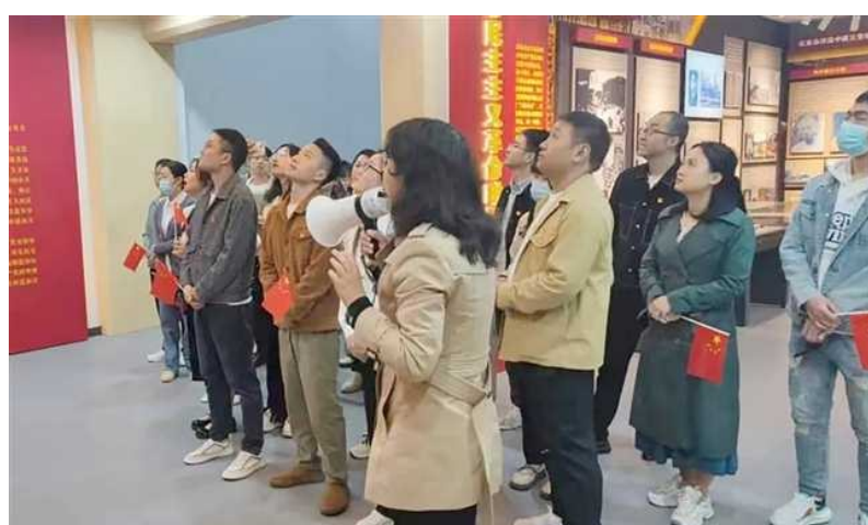
参观垫江廉政教育基地

目前,医院以选拔、培养、任用内设机构负责人担任党支部书记,将支委班子覆盖各重点科室,力争内设机构负责人担任支部书记达100%,其中,医院共有党委委员8名,设立行政支部、后勤支部、内科一支部、内科二支部等10个党支部,中共党员241人。