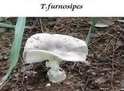
假褐云斑鹅膏 Amanita pseudoporphyria