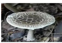
角鳞灰鹅膏菌 Amanita aspera