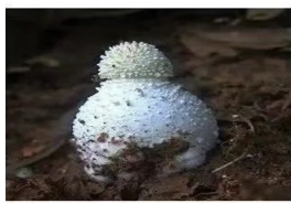
锥鳞白鹅膏 Amanita virginoides