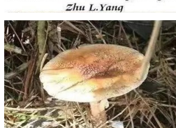
红柄鹅膏 Amanita orsonii