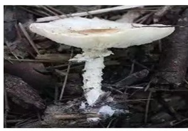
拟卵盖鹅膏菌 Amanita neovoides

垫江县人民医院相关负责人表示,医院肿瘤科将以更加奋进的姿态、更加全面的学术推进全县肿瘤支持与姑息治疗事业科学化、前沿化、仁爱化发展,全心致力于延长恶性肿瘤患者生存时间,提高患者及其照顾者的生活质量。