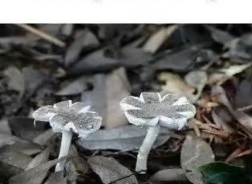
灰柄鳞鹅膏菌 Amanita aspera Pers. ex