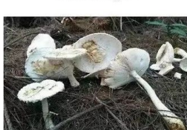
异味鹅膏 Amanita kotohiransis Nagas