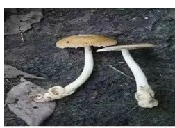
香黄鹅膏 Amanita cf. crocea