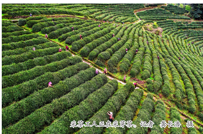
采茶工人在东印山采茶。

本报讯(记者 王俊杰)3月15日,记者从重庆市东印茶叶有限公司获悉,东印山首批春茶正式开采。