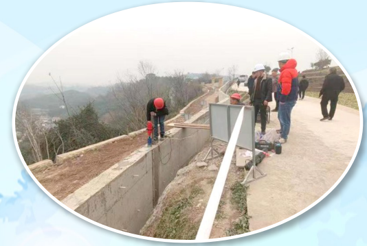
工作人员检查包家镇甄桥村美丽家园建设市级示范项目。