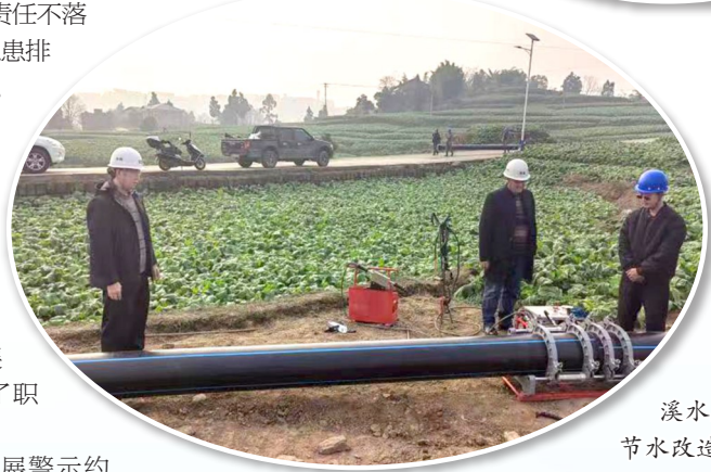
工作人员检查盐井溪水库中型灌区续建配套与节水改造项目(2022年度)。

针对水利安全事件,认真开展警示教育,要求全县水利行业引以为戒、举一反三,切实加强水利工程建设、水利工程运行、危化品、有限空间作业等安全隐患排查和整治工作,坚决遏制安全事故发生。