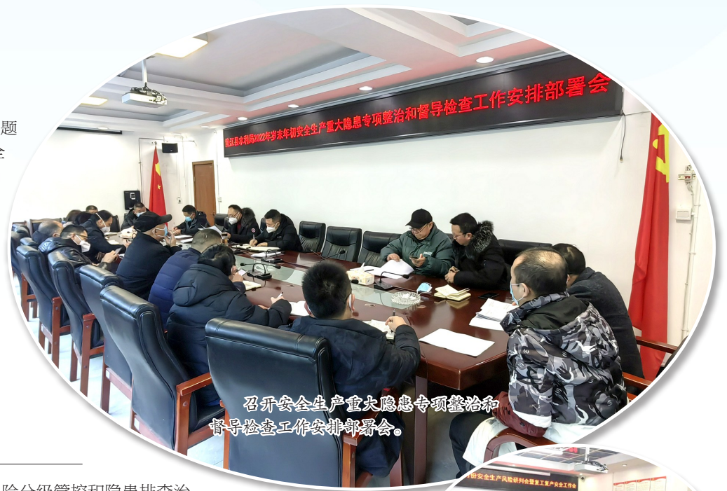
召开安全生产重大隐患专项整改和督导检查工作部署会。

3家,发现问题隐患8个,均全部完成整改。全面推行“两单两卡”,强化企业一线岗位从业人员安全生产责任。