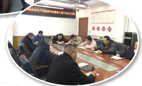
召开安全生产风险研判会。

此外,开展了水利行业安全大检查百日大整治“三查三治”工作,从领导干部履职、部门监管执法、主体责任落实三个方面开展自查,整治了履职形式化、表面化和安全生产责任不落实、安全监管“宽松软”,事故灾害隐患排查治理不全面不深入不彻底等问题。